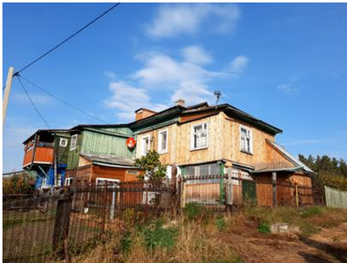
Дача Сабанеевых, д. Вакарево